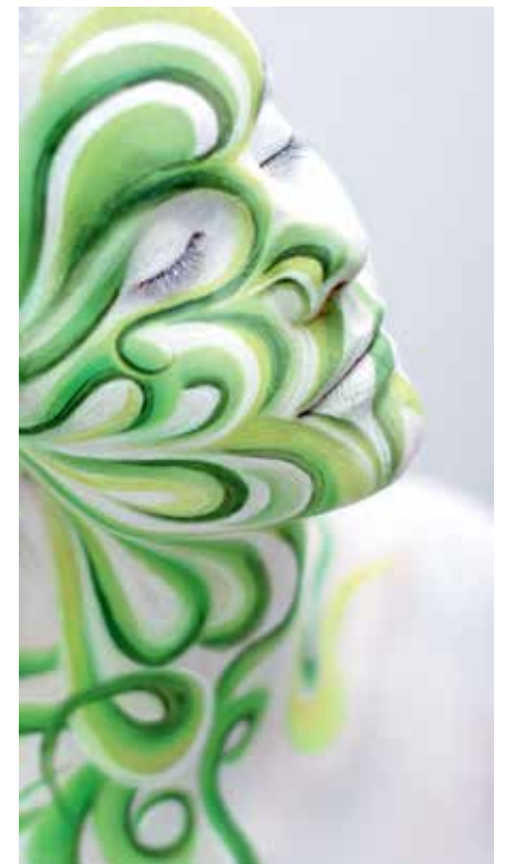
Suurin osa malleiksi ryhtyneistä toivovat saavansa maalia pintaansa vielä joskus uudelleen, sillä kokemus on ainutlaatuinen.